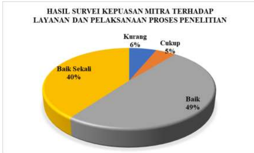
Diagram 4.1 Persentase Hasil Survei Kepuasan Mitra terhadap Proses Layanan dan Pelaksanaan Proses Penelitian pada Program Studi Manajemen

Berdasarkan hasil survei dapat dilihat pada Diagram 4.1 yang menggambarkan bahwa secara keseluruhan Mitra program studi Manajemen memberikan nilai Baik Sekali sejumlah 40%, nilai Baik sejumlah 49%, nilai Cukup sejumlah 5%, nilai kurang 6%. Jika merujuk pada Tabel 2.3 nilai persentase tersebut berada pada rentang 41-60%, sehingga dapat disimpulkan bahwa kepuasan Mitra terhadap proses Layanan dan Pelaksanaan Proses Penelitian di program studi Manajemen masuk pada kategori CUKUP BAIK .